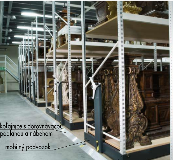
koľajnice s dorovnávacou podlahou a nábehom mobilný podvozok