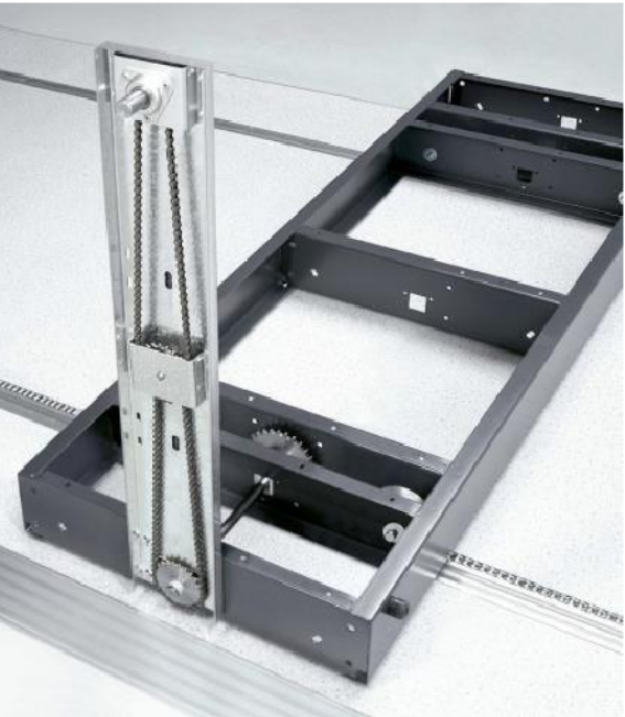
podvozok a koľajnice s reťazou

súčasťou dodávky regálu je jeho označenie. označenie je formátu A4 ( 210x 297mm). pevná podložka s priehľadným obalom, do ktorého sa dá vkladať hárok papiera formátu A4. Papier sa dá ľahko meniť, aby sa obsah mohol podľa potreby aktualizovať. spôsob uchytenia pevnej podložky je realizovaný tak, aby nezasahoval do priestoru uskladňovaných premetov.każdý jeden regál má vlastné označenie.